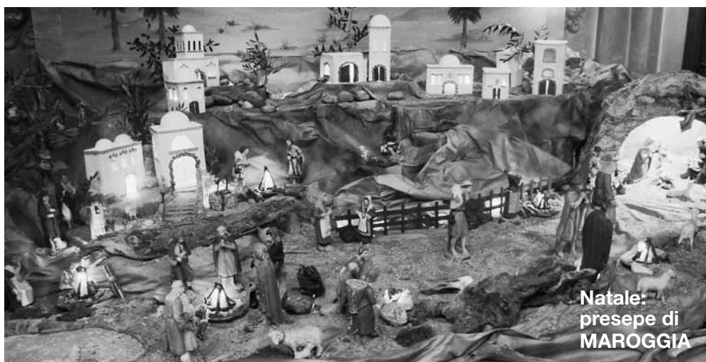
Natale: presepe di MAROGGIA