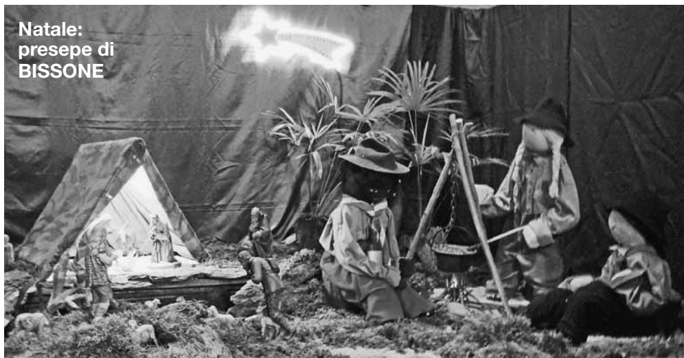
Natale: presepe di BISSONE