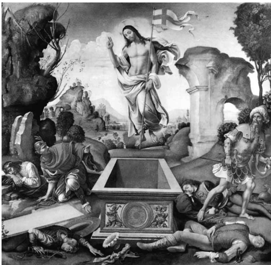
RAFFAELLINO DEL GARBO, Resurrezione, 1810