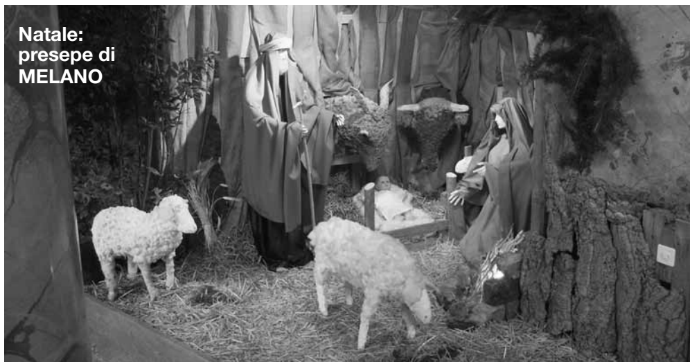
Natale: presepe di MELANO