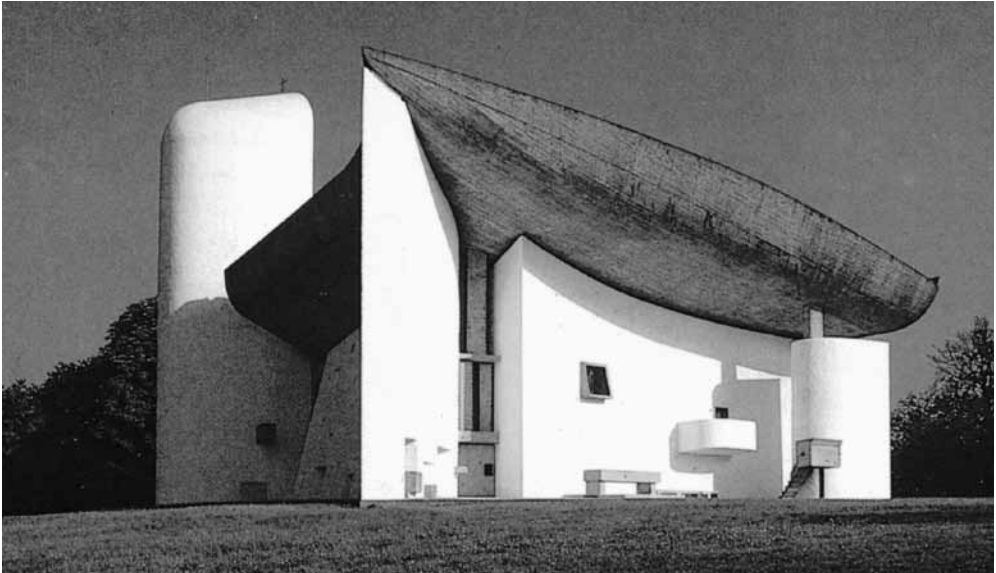
Chiesa di Ronchamp (Francia) - architetto: Le Corbusier