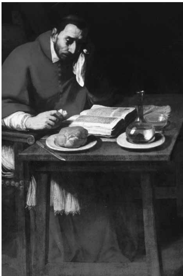
Daniele Crespi, «Il digiuno di San Carlo» (1628) Milano, chiesa della Passione

Parte essenziale dell'opera della riforma cattolica è stata la valorizzazione delle